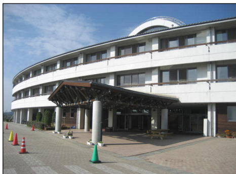
いわき海浜自然の家・本館

利用料金や利用方法、企画事業の申込方法など、詳しくはいわき海浜自然の家のホームページをご覧ください。電話でもお気軽にご相談ください。